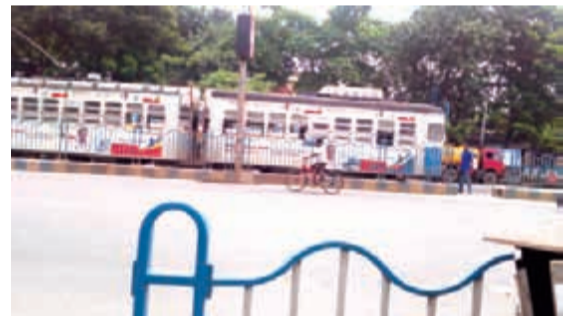
കുതിച്ചുപായും മെട്രോ കൊരിക്കത്തിലെ ഗതാഗത സൗകര്യം അസഹനീയമായ അനുഭവമാണ്. ഒരു കിലോമീറ്റർ ദൂരം പിന്നിടാൻ