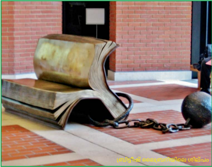
ബ്രിട്ടീഷ് ലൈബ്രറിയിലെ ശില്പം

പതിനെട്ടാംശതകത്തിന്റെ ആദ്യദശകങ്ങളിലാണ് യൂറോപ്പിൽ ഗ്രന്ഥശാലകൾ വിപുലീകരിക്കപ്പെട്ടത്. ഇതിനെത്തുടർന്ന് അച്ചടി, നാണയങ്ങൾ, അച്ചടിച്ച ഗ്രന്ഥങ്ങൾ, ഹസ്തലിഖിതങ്ങൾ എന്നീ നാലു വകുപ്പുകൾ പാരിസിലെ ബിബ്ലിയോമെക് നാഷണലിൽ ആരംഭിച്ചു. അന്നു സ്വകാര്യ സ്വത്തായിരുന്ന ലൈബ്രറികൾ 1735 ലാണ് പൊതുജനങ്ങൾക്കായി തുറന്നുകൊടുക്കുന്നത്. ബിബ്ലിയോമെക്സിന്റെ ഡയറക്ടറേറ്റ് ഓഫ് ലൈബ്രറീസിന്റെ മേൽനോട്ടച്ചുമതലയിൽ എല്ലാ പബ്ലിക് ലൈബ്രറി കളിലെയും ലൈബ്രറിവിദ്യർ ധർമ്മ പരിശീലനം നൽകിയതോടെ ബ്രിട്ടൻ ഇതാവർത്തിക്കാൻ നിർബന്ധിതരാവുകയായിരുന്നു. രാജ്യത്തിനുള്ളിൽ പ്രസിദ്ധപ്പെടുത്തുന്ന എല്ലാ ഗ്രന്ഥങ്ങളുടെയും ആനുകാലികങ്ങളുടെയും ഓരോ പ്രതി സൗജന്യമായി നാഷണൽ ലൈബ്രറിക്ക് അയച്ചുകൊടുക്കണമെന്ന ഫ്രഞ്ചുനിയമം ബ്രിട്ടനും കർശനമാക്കി. അങ്ങനെയാണ് ബ്രിട്ടന്റെ കോളനികളിലുണ്ടായിരുന്ന പുസ്തകങ്ങളുടെയെല്ലാം ആദ്യകൃതികൾ കടൽ കടന്നതെന്നു കരുതപ്പെടുന്നു.