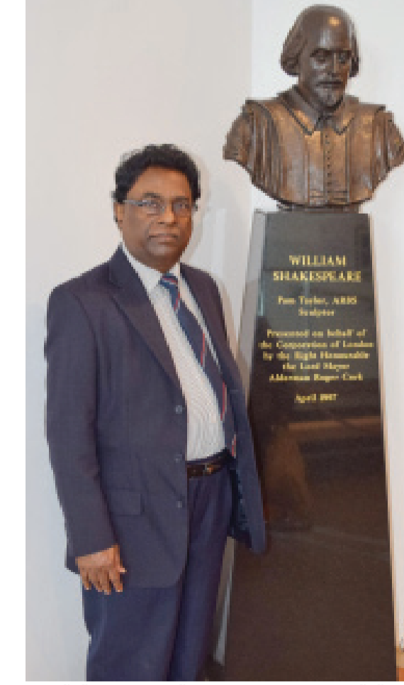
ഷേക്സ്പിയർ ഗ്ലോബ് തിയേറ്ററിൽ വിലയും ഷേക്സ്പിയറിന്റെ പ്രതിമയ്ക്ക് മുന്നിൽ ലേഖകൻ

1970 കളിൽ അമേരിക്കയിൽ നിന്നെത്തിയ സംവിധായകനും നടനുമായിരുന്ന ശബുദേവ് വാനമേൽക്കാണ് ഷേക്സ്പിയർ ഗ്ലോബിന് താങ്ങും തണലുമായത്. ലണ്ടനിൽ 230-ലധികം തിയേറ്ററുകളുണ്ട്. ഇവിടെയെല്ലാം ആയിരക്കണക്കിനുള്ള കളാണ് നാടകങ്ങൾ കണ്ടിറങ്ങുന്നത്. ഈ സമയം നമ്മുടെ