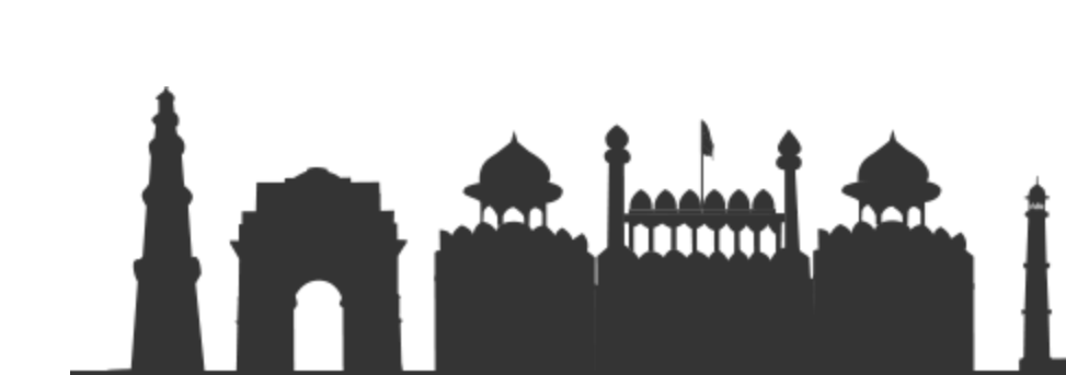
നഗര നയ കമ്മീഷൻ രൂപീകൃതമാകുമ്പോൾ