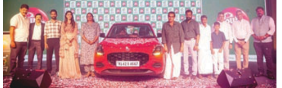
ഡബിൾഹോഴ്സ് ഗോൾഡൻ ഗേറ്റ് എവേ - സീസൺ-2 ന്റെ വിജയികളെ ആദരിക്കുന്ന ചടങ്ങിൽ ഗോൾഡൻ ഗേറ്റ് വിതരണം നടത്തിയപ്പോൾ

കൊച്ചി: ഡബിൾ ഹോഴ്സ് ഉപഭോക്താക്കളുടെ മനം കവർന്ന ഡബിൾ ഹോഴ്സ് ഗോൾഡൻ ഗേറ്റ് എവേ ക്യാമ്പെയിൻ സീസൺ രണ്ടിന് ആഘോഷസമ്മാനമായ പരിസമാപ്തി. ഫെബ്രുവരി 25-ന് താഴെ വിവരം, മറ്റേ റൈസ് ഡെവലപ്മെന്റ് ക്യാമ്പെയിൻ ഔദ്യോഗികമായ സമാപനം. ഗോൾഡൻ ഗേറ്റ് എവേ ആദ്യ സീസണിന്റെ തുടർച്ചയായി അവതരിപ്പിക്കപ്പെട്ട സീസൺ രണ്ട്, ആദ്യ സീസണിന്റെ വിജയചരിത്രം ആവർത്തിക്കുകയായിരുന്നു. പൂട്ട് പെടി, അപ്പം-ഇടിയപ്പം-പത്തിരി പൊടി, റവ, ശർക്കര, ഈസി പാലപ്പം, ഈസി ഇടിയപ്പം, ഈസി പത്തിരി പൊടി, ഇൻസ്റ്റർ ഇടിയപ്പം തുടങ്ങിയ ഉൽപ്പന്നങ്ങളിലായിരുന്നു ആകർഷകമായ ഈ ഓഫർ അവതരിപ്പിച്ചിരുന്നത്. ഉപഭോക്താക്കളെ ആകർഷിക്കാൻ അവതരിപ്പിച്ച ഈ ക്യാമ്പെയിൻ, ഒട്ടേറെ വലിയ സമ്മാനങ്ങളാണ് മത്സരാർത്ഥികൾക്ക് കൈമാറിയത്. മാതൃതി സിഫ്റ്റ് കാർ, സിംഗിൾ യാത്ര തുടങ്ങിയ മെഗാസമ്മാനങ്ങൾക്കൊപ്പം