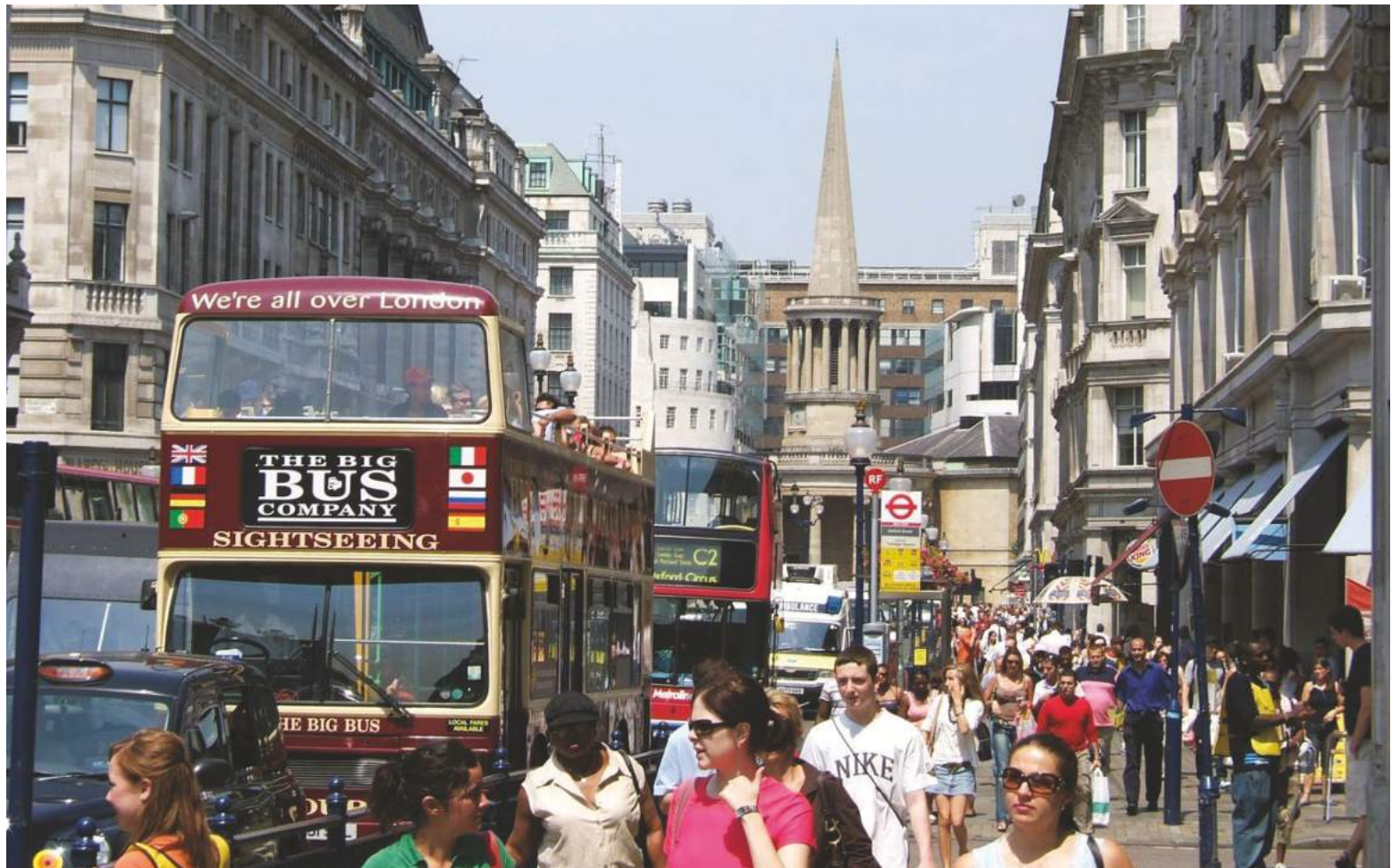
ലണ്ടൻ നഗര ദൃശ്യം

ജീവിതയാഥാർത്ഥ്യങ്ങളെ സൂക്ഷ്മമായി ആവാഹിച്ച് നൂതനമായ ഭാവുകതയോടെ ആവിഷ്കരിക്കാൻ അച്ഛൻ നാടകവേദി വളർന്നുകൊണ്ടിരിക്കുന്ന സൂചനകളാണ് സംഗീത നാടക അക്കാദമിയുടെ അച്ഛൻ നാടകമത്സരം നൽകുന്നത്.